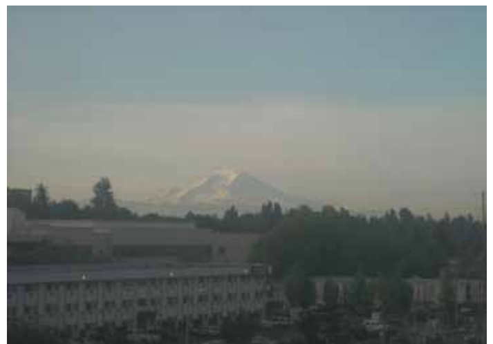
写真は、滞在していたホテルの窓から見えるマウント・レーニアです。 （室員 上宮 愛）